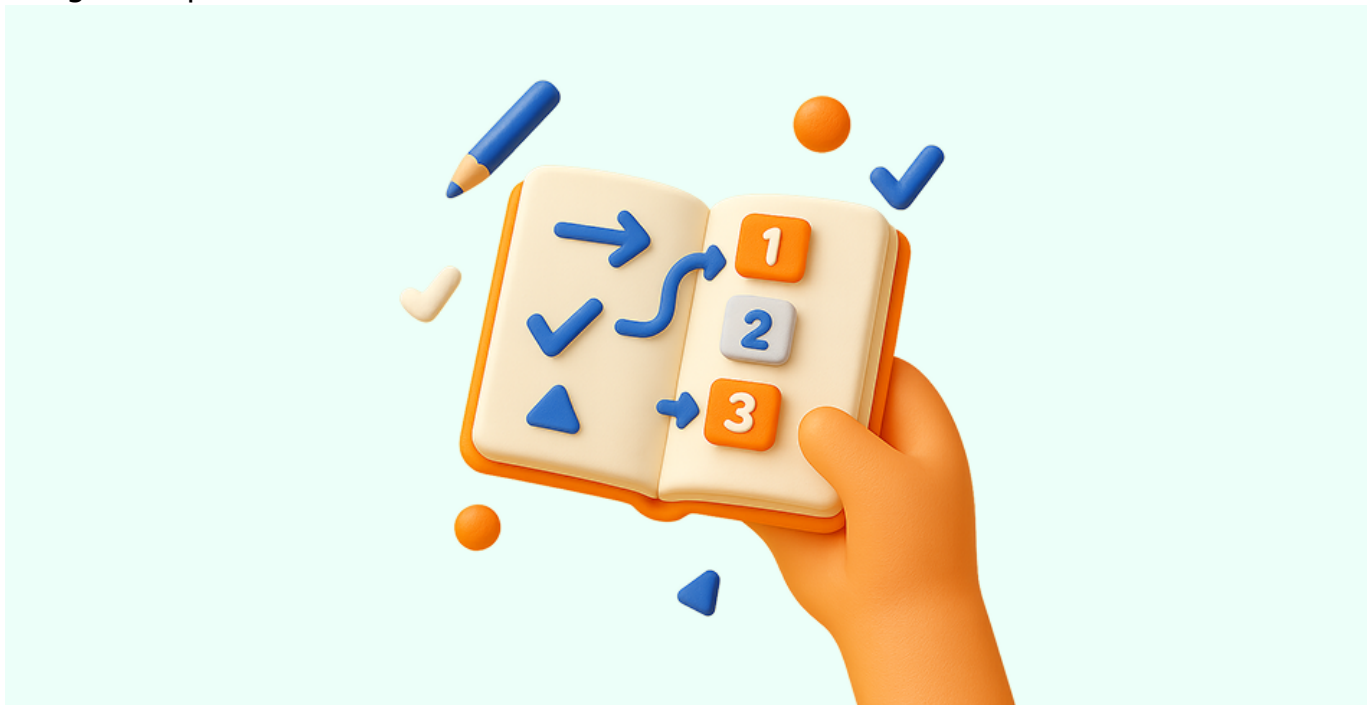
Imagen de portada

1.2 Identifica barreras para el aprendizaje